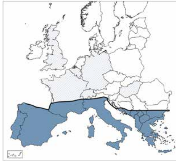
Fig. 1 Globale verspreiding van leishmaniase bij de hond in Europa: (Endemische gebieden in blauw waarbij de zwarte lijnen globaal de noordelijke grens aangeven. De lichtere blauwe lijnen markeren de landen waar individuele, schijnbaar niet-import gevallen optraden)

Het is erg belangrijk om rekening te houden met verschillende (exotische) parasieten, zoals zandvliegen en muggen.